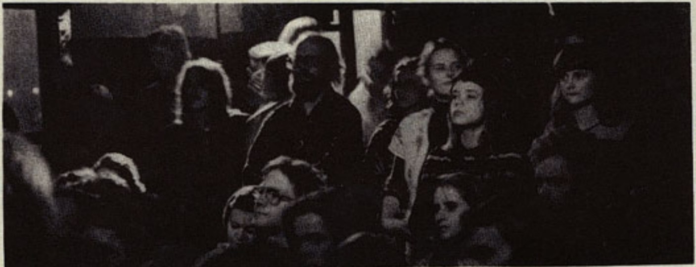
Andaktsfull stämning på klubben - Storg 3