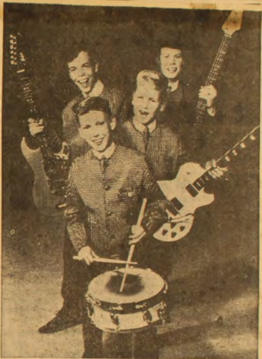
★ Bland The Alligators meriter finner man bla gästupträdanden tillsammans med The Spotnicks och Owe Thörnqvist.