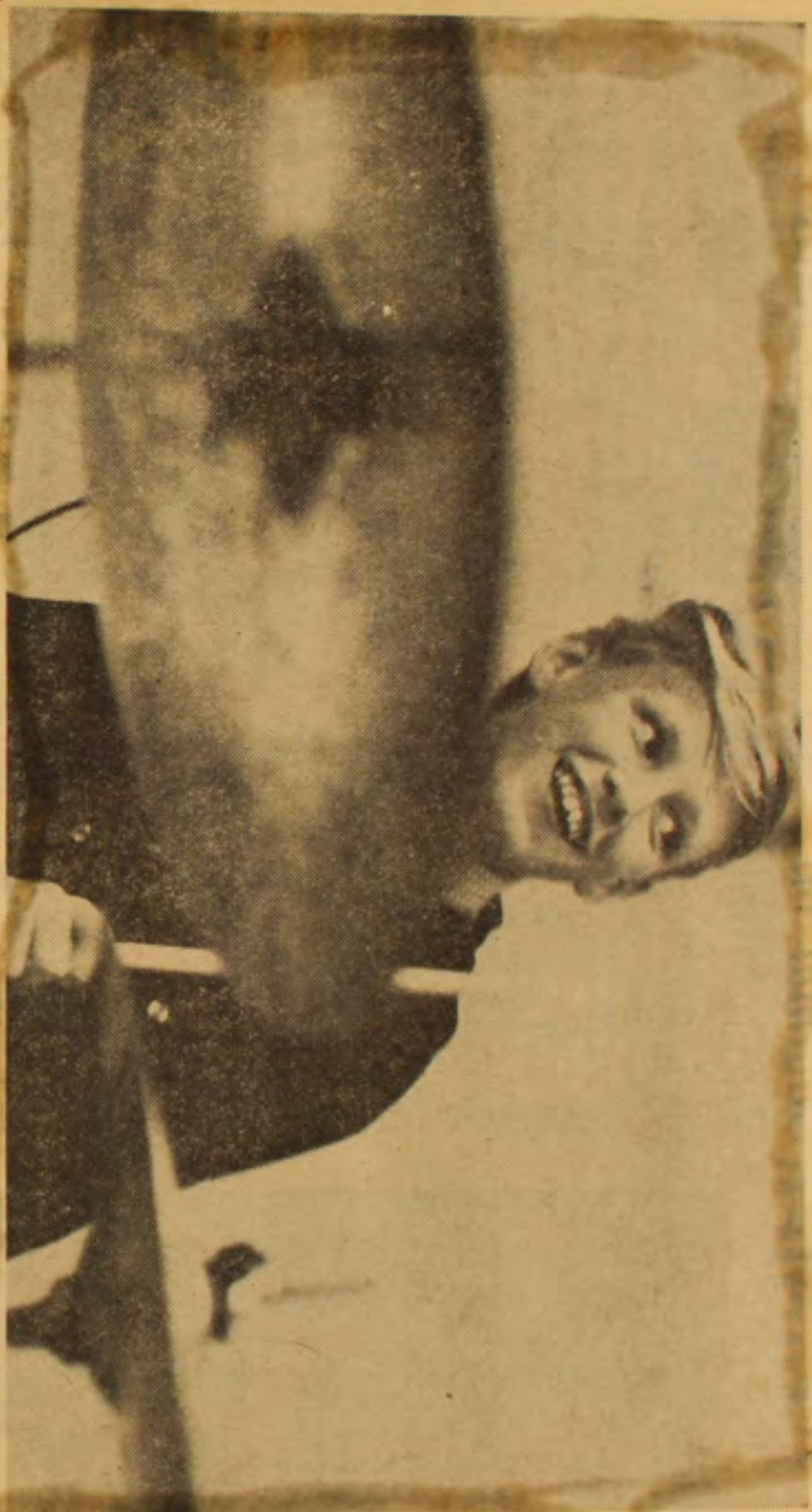
Sjunde Fergar lyser bakom kaggarna. Han har lärt sig så en vrvvel på 1 2. Men att spela pop-trumma har han lärt sig själv.